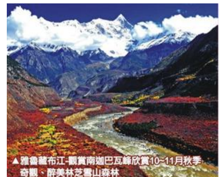
▲雅魯藏布江-觀賞南迦巴瓦峰欣賞10~11月秋季奇觀、醉美林芝雪山森林

看點二：林芝桃花與杜鵑百花盛宴，踏著春天的旋律，為花而狂，趕赴這場華麗的盛美。 每年 4~5 月漫山遍野的桃花開始鋪滿山坡，綿延至河谷；漫步其中，可見雪峰聳立，桃花怒放，清泉嬉戲，藏寨悠然美到令人屏息。尤其是進入 5 月中旬一直持續到 6 月中旬，春天豔陽高照，雪山之下，色季拉山的杜鵑花期也長，無論是東坡還是西坡，整座山上的杜鵑花全部綻放，黃色、紫色，千姿百態，形成花的海洋，氣勢極為浩瀚壯觀。而 10 月~11 月中下旬期間，魯朗林海更是猶如「上帝打翻的調色盤」讓人美麗驚艷，喜愛攝影的您不絕不可錯過！