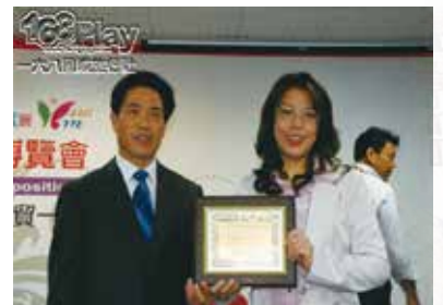
孫董榮獲西藏最高榮譽金旅獎